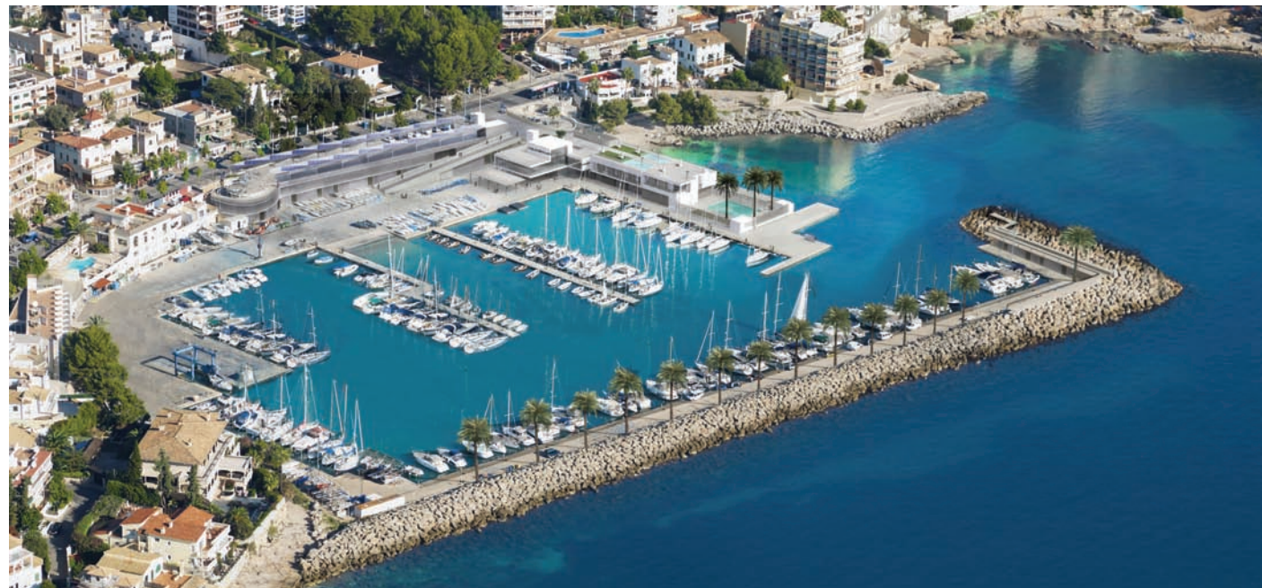
Fotografía anteproyecto Port Calanova.

Íntimo e inconfundiblemente elegante, Port Calanova ofrece la base ideal para propietarios y sus familias, capitanes y tripulación.